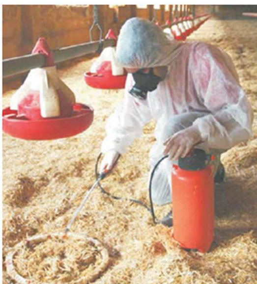
Desinfección de Alphitobius diaperinus en granja avícola

Cuando se produce el vaciado de los pollos de la nave, tanto los adultos y las larvas abandonan el piso que compartían con las aves y migran hacia las galerías que otras larvas excavaron antes. Esto se debe a la brusca bajada de las temperaturas que se produce en este momento, cuando se pierde el calor metabólico generado por las propias aves. La sensación de frío se agudiza por la ventilación total que se produce al abrir todas las ventanas para facilitar el aire de la nave. Es en este momento, posterior al vaciado, cuando los granjeros o técnicos suelen aplicar el insecticida. Esto es un completo error, porque las migraciones se producen inmediatamente a la salida de los pollos, de forma que el insecticida aplicado no tendrá ningún efecto sobre los escarabajos o larvas, los cuales se encuentran resguardados en sus galerías. Permanecerán allí esperando la entrada del siguiente lote, el cual llevará consigo una subida de la temperatura de la nave generando así el ambiente idóneo para que el Alphitobius diaperinus pueda re aprender su actividad.